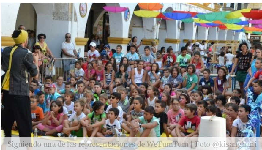
Siguiendo una de las representaciones de WeTumTum

CIUDAD RODRIGO | El intenso calor no fue óbice para que cientos y cientos de niños se lo pasasen en grande